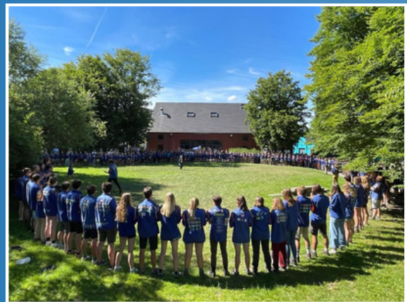
Grote eindformatie aan de Oepites in Zomergem (2022)