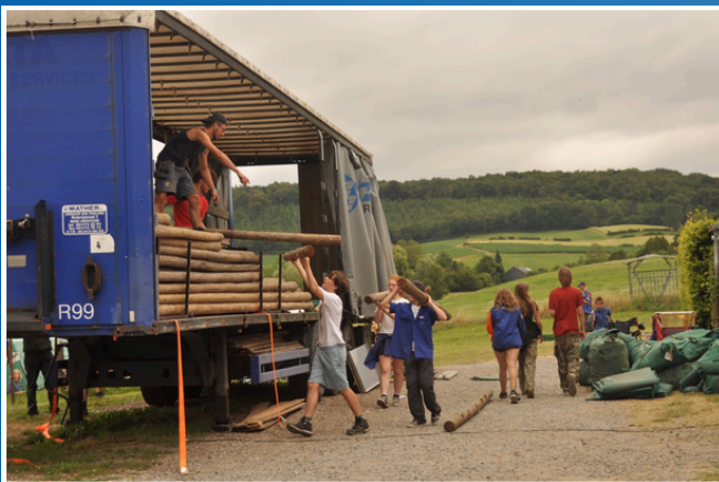
Vullen van de camion op het kampterrein (2022)

Eveneens blijft de terugkomst geheel hetzelfde als vorige kamp-edities. We keren met iedereen en al ons materiaal terug op 11 juli , wederom met de bus. Aankomst staat gepland tegen de namiddag. Zoals gewoonlijk beginnen we meteen met het uitladen van onze camion, niet veel later volgt de eindformatie. Belangrijk om mee te delen is dat deze eindformatie een fundamenteel onderdeel is van ons kamp. Het is daarom ook fijn als alle kinderen bij deze aanwezig zijn om afscheid te nemen van hun vriendjes en leiding!